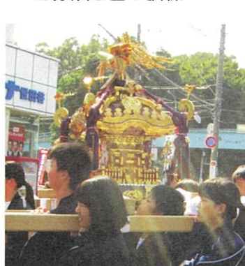
粕谷八幡神社まつり神輿