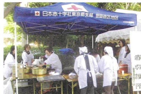
トライアングルフェスティバル 日赤炊き出し訓練