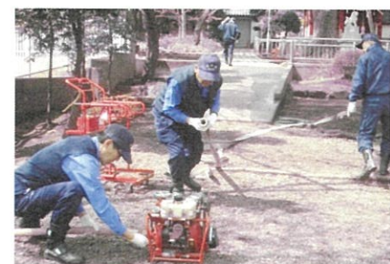
D型ポンプ消火訓練