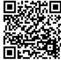
災害時給水ステーション一覧