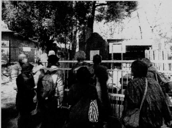
昨年度の説明の様子