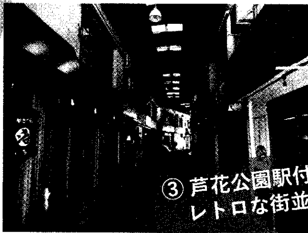
③ 芦花公園駅付近の レトロな街並

上北沢にある銭湯で湯につかりな がら、銭湯絵師による浴室に描か れた富士山のペンキ絵を楽しむこ とができます