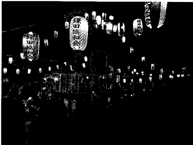
夏の天神社納涼大会

祭礼をはじめ、町会員旅行や子ども中心のイベントを行って皆さんの関心を引いていますが、なかなか会員は増えません。この現象は世田谷区全体の問題と言うよりも全国的な問題かと思えます。