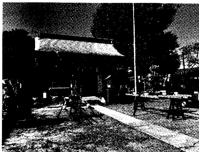
秋の鎌田天神社祭礼

これからも時間を掛けて町会員を増やすべく、明るく楽しい町会になるよう努力し、世田谷区の一町会として会員の増えるよう頑張ります。