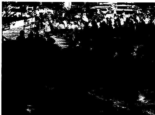
蘆花まつりのようす