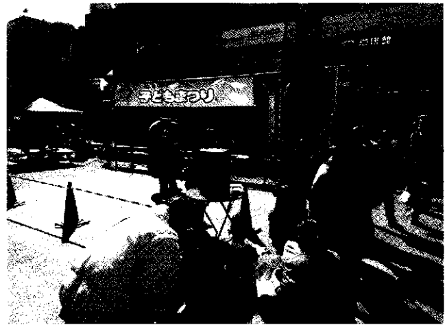
烏山地域の人気者「からびょん」

話は変わりますが、この地域を貫く京王線では現在、連続立体交差事業の工事が本格的に進んでいます。完成まではまだ時間がかかりそうですが、駅には完成時の駅のデザインなども張り出されています。少しずつ高架も姿を現しはじめています。2030年度末まで事業が続くということではありますが狭い道が多く、開かずの踏切状態が1日も早く解消されることを願っています。