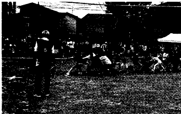
まちぐるみ運動会