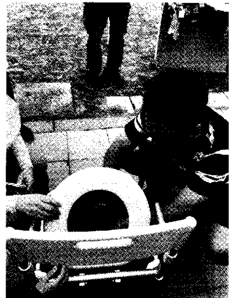
避難所トイレ組立訓練

そんなわけで、小学校が「6歳から12歳までの教育機関」だけではなく、実質的に街づくりの中心となっていることを地域振興課にも認識いただき、「教育と街づくりの複合施設」として強化してくださることを期待しております。