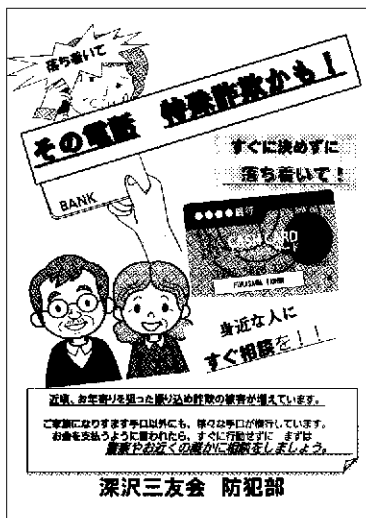
振り込めサギ防止ポスター

特に上記4点におきましては、町会員だけでなく、地域の皆様が被害に合わないよう掲示して注意を呼び掛けています。