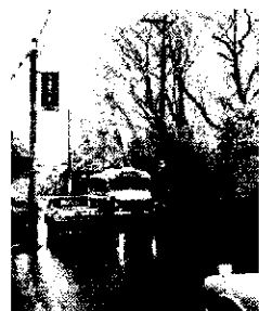
昭和44年～49頃 お宮の坂